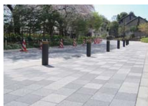
千代田区千鳥ヶ淵 (東京都)