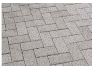
王子五丁目 (東京都) G16・E16 使用