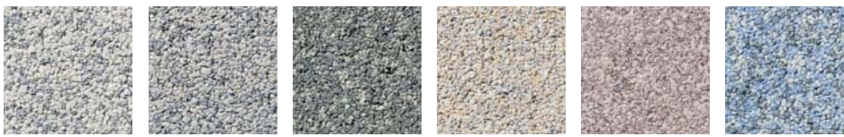
M11 ホワイト M12 ダークグレー M15 モスグリーン M16 イエロー M13 ローズ M19 ブルー