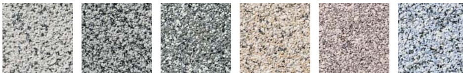
G11 ホワイト G12 ダークグレー G15 モスグリーン G16 イエロー G13 ローズ G19 ブルー